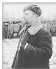
Православный священник выступает перед бойцами партизанского соединения.

Первый Парад Победы состоялся 24 июня 1945 года на Красной площади. Его принимал маршал Георгий Жуков, сидя верхом на белом коне, подобно своему небесному покровителю. В параде Победы участвовали сводные полки наиболее отличившихся героев всех 11 фронтов и Военно-Морского флота во главе с их командующими. Особому батальону было поручено бросить к ногам советского народа победителя 200 поверженных фашистских знамён и штандартов. “Десятками, сотнями падали на мокрую землю знамёна разбитых немецких корпусов, дивизий, полков, знамёна, ещё недавно кичливо развевавшиеся над покорёнными странами Европы, знамёна с проклятой свастикой, которую Гитлер вознамерился водрузить над всем миром”. (Борис Полевой). А вечером над страной гремел праздничный салют Великой Победы.